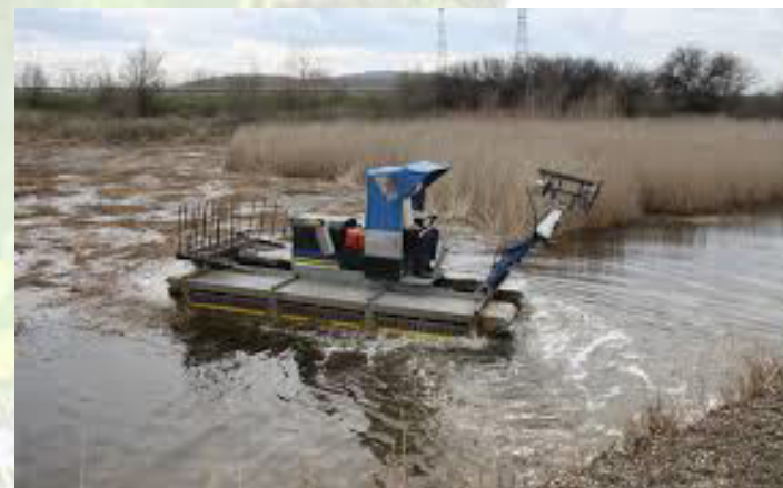
Косене на тръстика