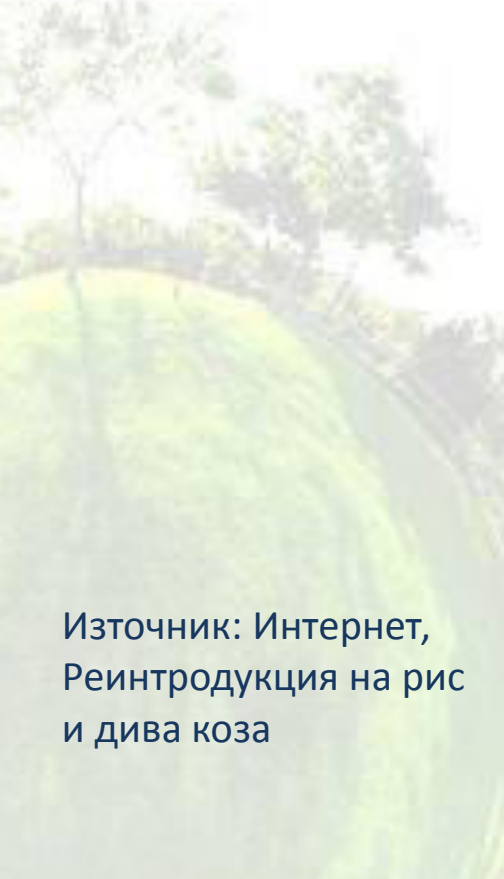
Източник: Интернет, Реинтродукция на рис и дива коза