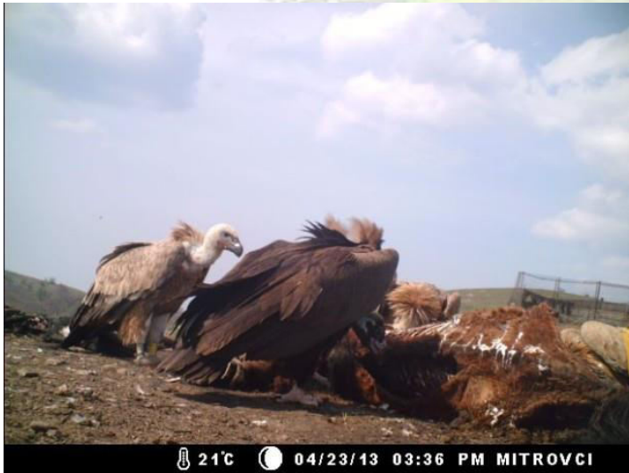
Източник: ДПП Сините камъни, подхранване на черен лешояд в ПП