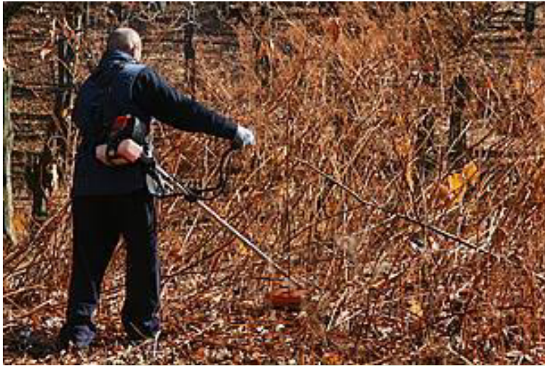
Премахване на инвазивен вид rainutria japonica в Природен парк Българка